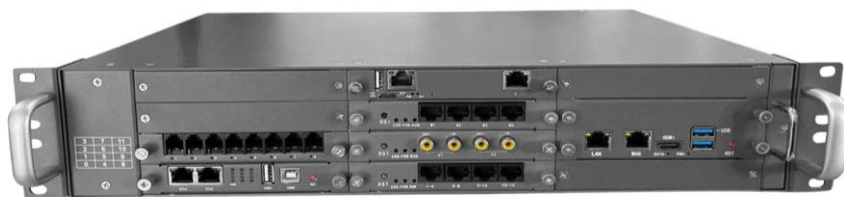
图 1-1-1 正面示意图