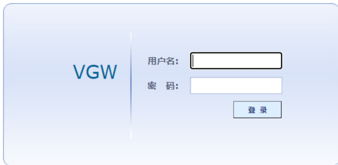
图 2-1-1 音频网关登录界面

登录网关网页：打开 IE 输入 http://IP ，（IP 为无线网关设备地址，默认 10.20.40.40），进入如下图 1-1-1 所示登录界面。初始用户名： admin ，密码： 1