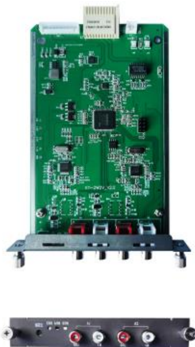
图 1-2-1 VS-GWM501V 板卡示意图